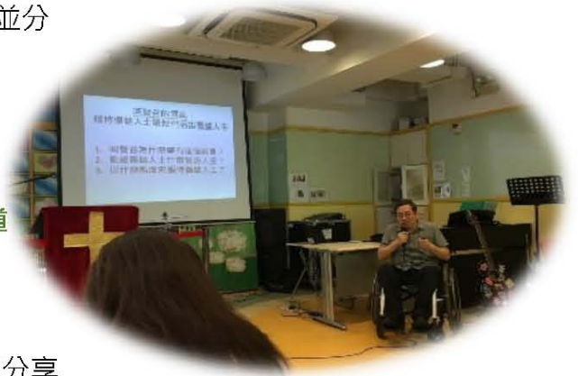
將軍澳基督徒會講道