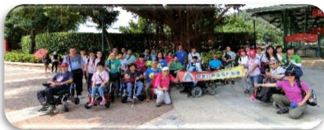
港東及將軍澳團友及義工到迪士尼遊玩