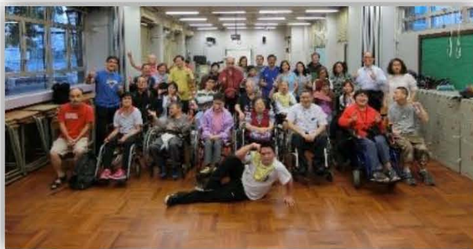
基督教九龍五旬節會主領崇拜