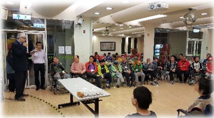
匡智粉嶺綜合復康中心 週五晚間崇拜

8) 每週星期五到匡智粉嶺綜合復康中心主領晚間崇拜，與及隔週星期一到將軍澳懷智綜合復康中心為弱能人士舉行福音聚會，每次分別平均 30 人出席；2019 年 1-12 月共聚會 46 次。