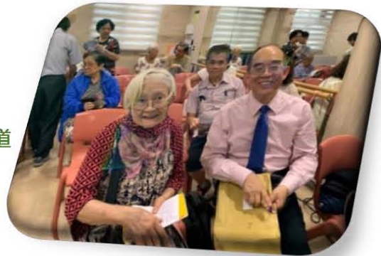
新生命浸信會講道