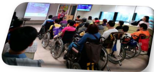
九東團契成立30周年團慶