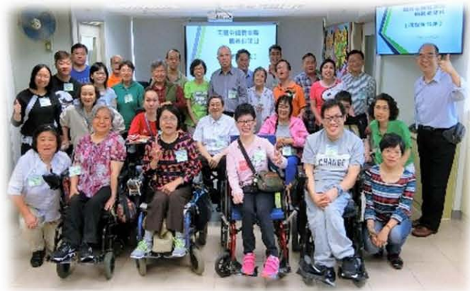
2019年團契職員會退修日