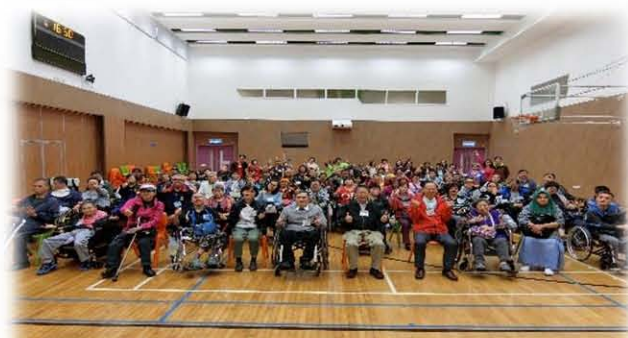
12月21日回聲谷31周年會慶