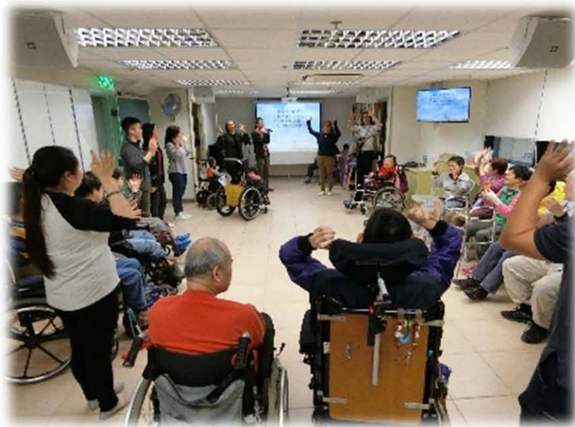
宣道會北角堂帶領活動