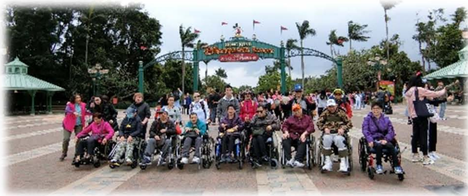
九中團契迪士尼活動