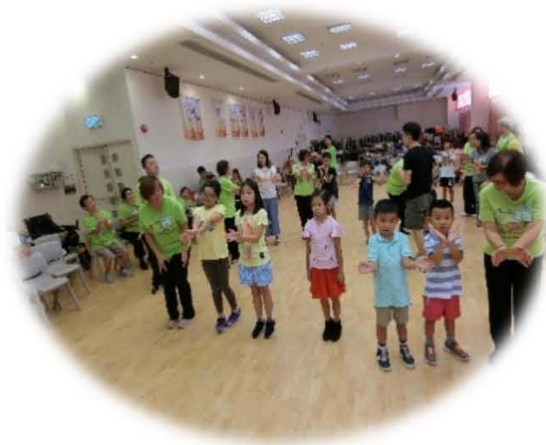
讚美操到優質音樂學校