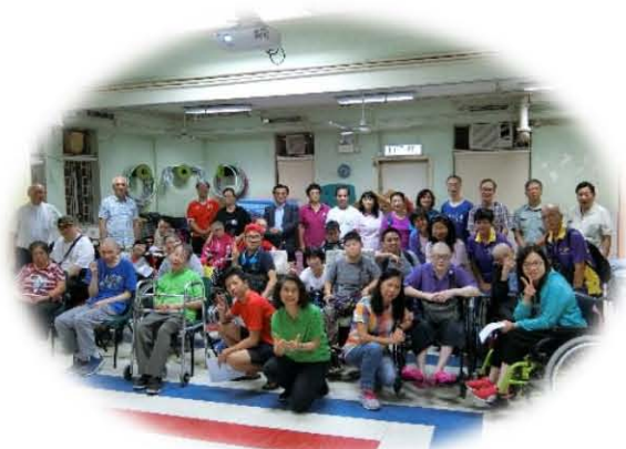
屯元團契與屯門堂男子漢合團活動