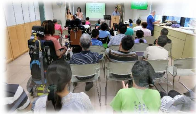
6月16日及6月23日 基督會弟兄姊妹協助帶領主日崇拜

8) 每週星期五到匡智粉嶺綜合復康中心主領晚間崇拜，與及隔週星期一到將軍澳懷智綜合復康中心為弱能人士舉行福音聚會，每次分別平均 30 人出席；2019 年 1-12 月共聚會 46 次。