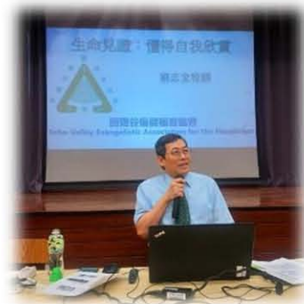
培英中學生命教育講座