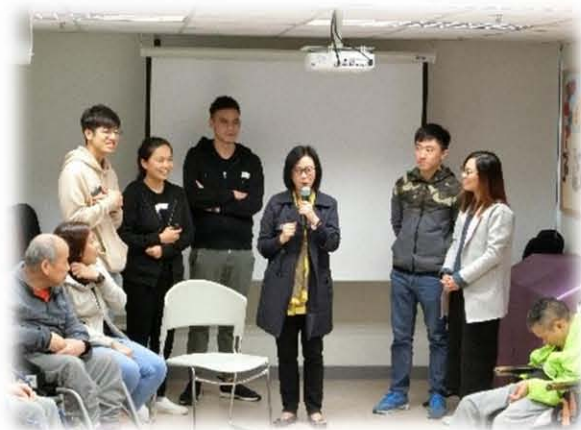
牛池灣竹園潮語浸信會主領聚會