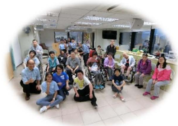
中華宣道會宣中堂參與回聲谷主日崇拜