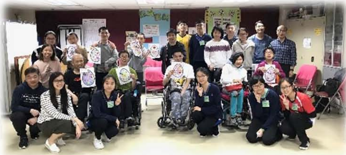
義工參與團契服侍