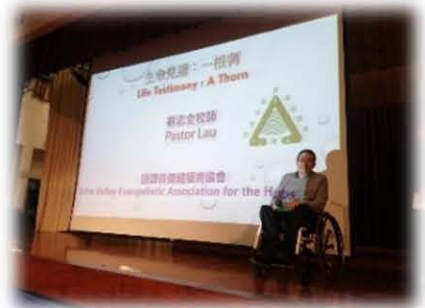
伯特利中學生命講座