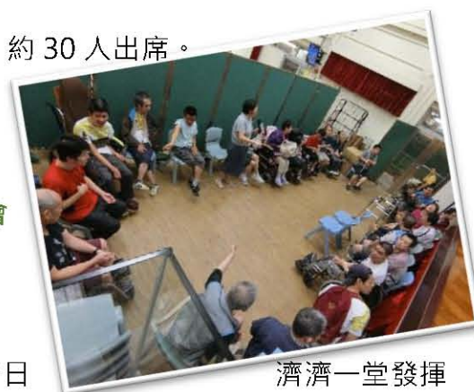
九中團契在盛康園舉辦佈道會