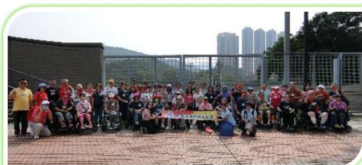
10月12日回聲谷舉行步行籌款