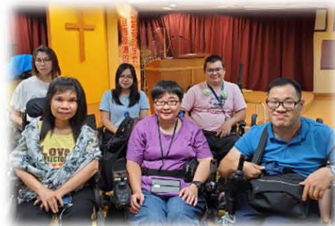
雅比斯新團契籌委

15) 「雅比斯」新團契正在籌備，經過 6 次聚會，現有 6 位籌委，團契目標是宣教。在 9 月正式成立，聚會地點暫借宣道會美孚堂。